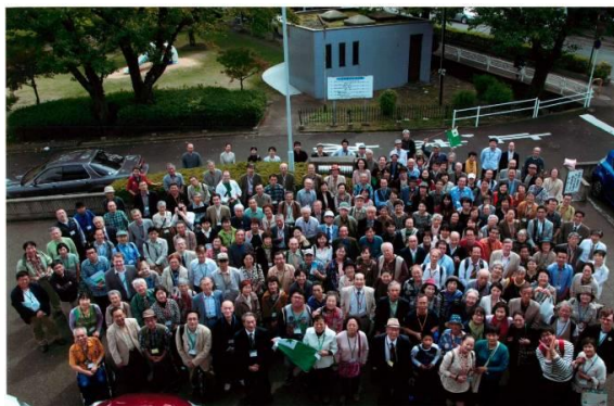
第101回日本エスペラント大会 La 101-a Japana Esperanto-Kongreso Obama Huku 2014年10月11日~13日