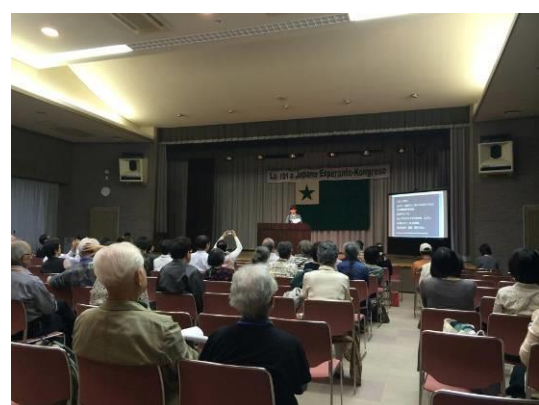
Arko prelegis en 101a Japana E-kongreso