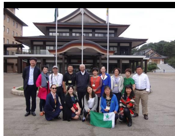
Cxinaj partoprenantoj al la ISOA