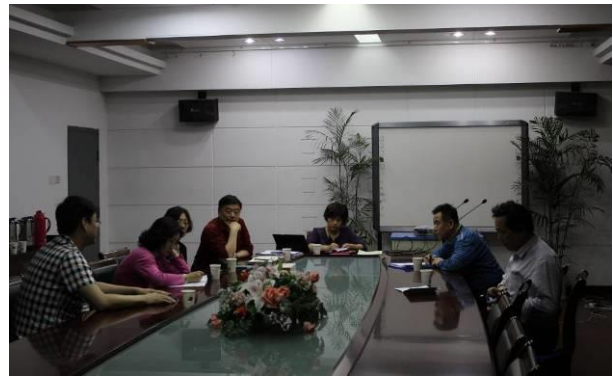
Estrara kunsido de Ĉina Ligo de Esperantistaj Instruistoj